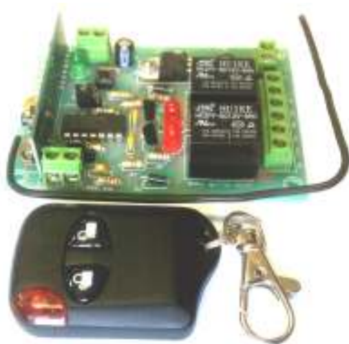
Рис.1 Общий вид

Устройство представляет собой модуль 2-х канального дистанционного радиуправления (рабочая частота 433МГц) с релейным выходом для каждого канала. С его помощью можно управлять на расстоянии самыми разными системами, например: освещением, радиоуправляемыми моделями, а также открывать и закрывать двери, жалюзи, шлагбаумы и т.п.